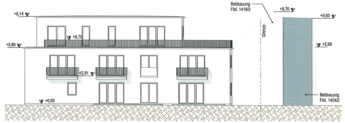
Westansicht M 1 : 200