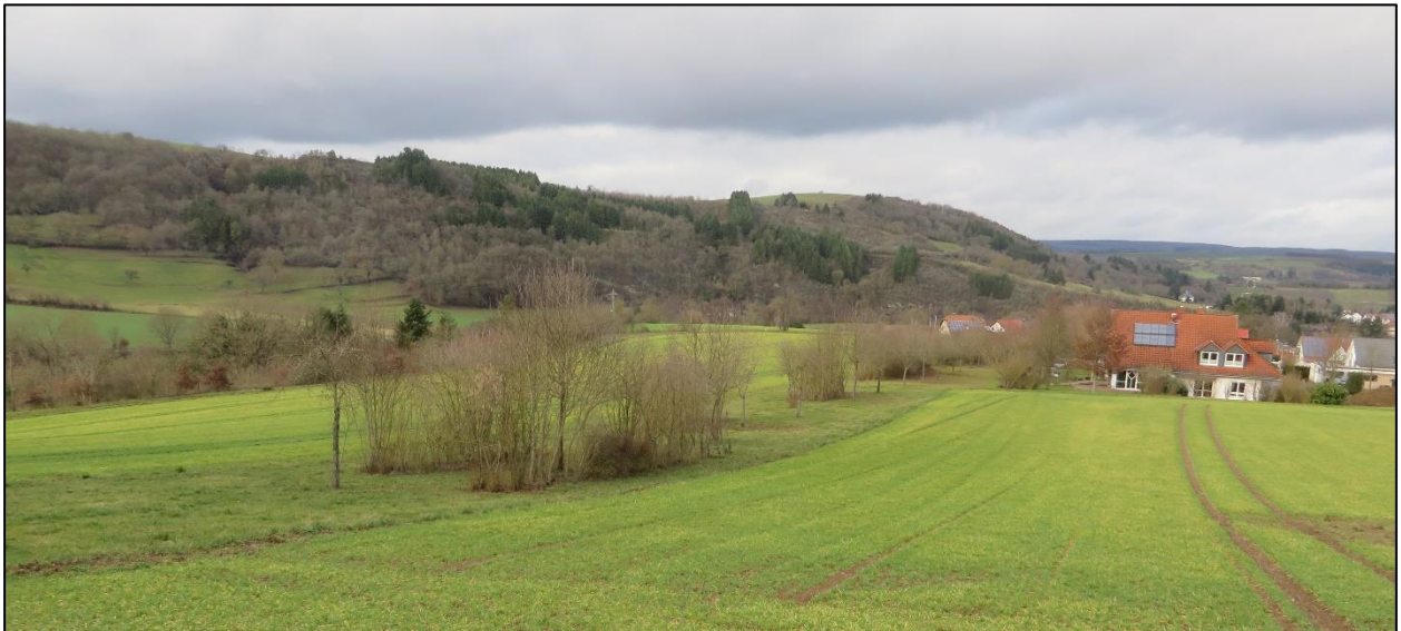
Abbildung 3: Südwestlicher Gebietsrand mit Gehölzinseln