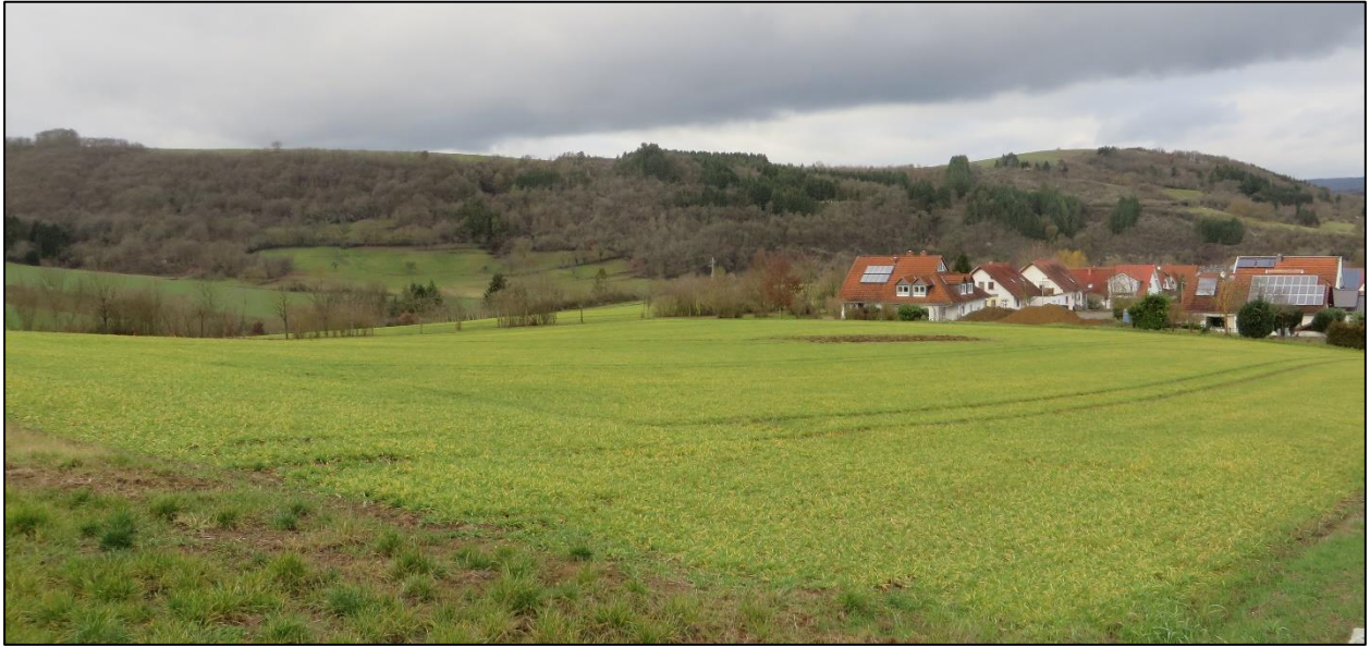
Abbildung 2: Blick auf das Plangebiet von Südosten