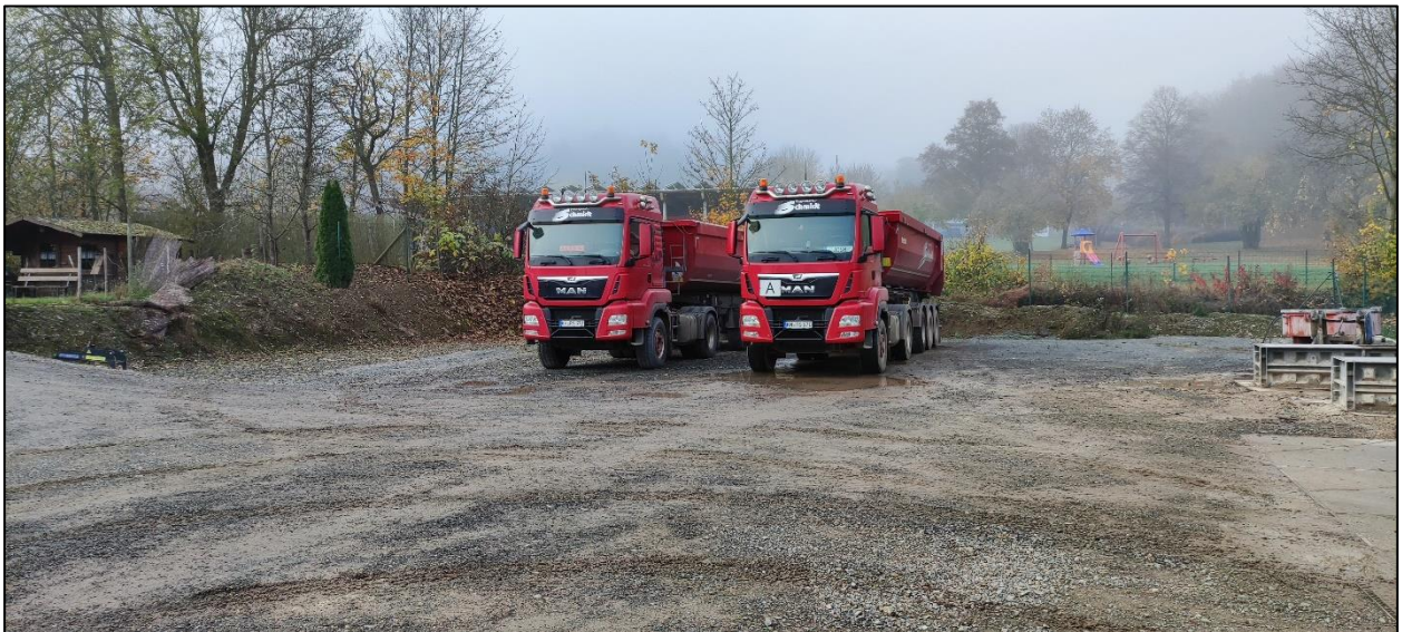
Abbildung 4: Blick auf die westliche Grundstücksgrenze