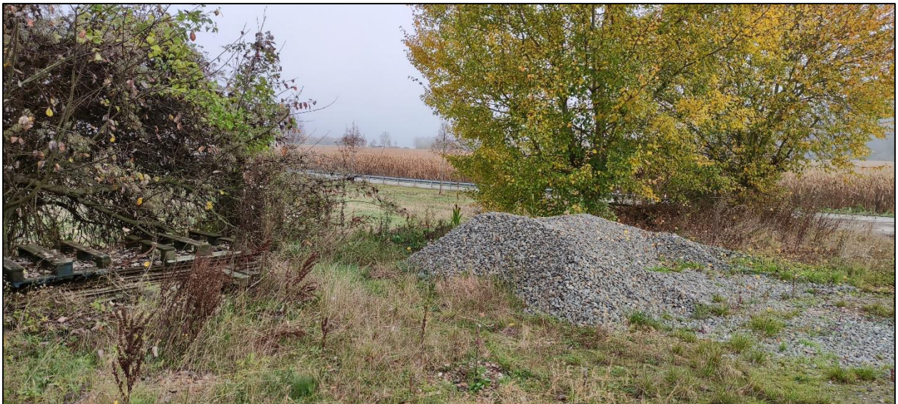
Abbildung 8: Gehölzstreifen im Norden mit Materiallagerung