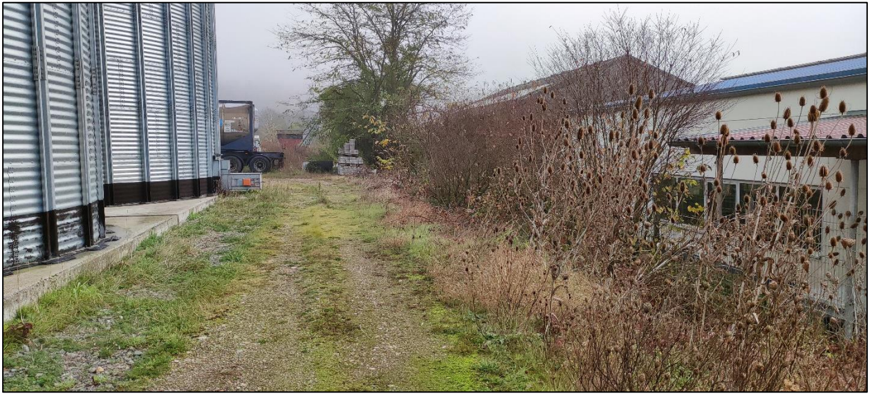
Abbildung 13: Gehölzstreifen im Süden des Grundstücks