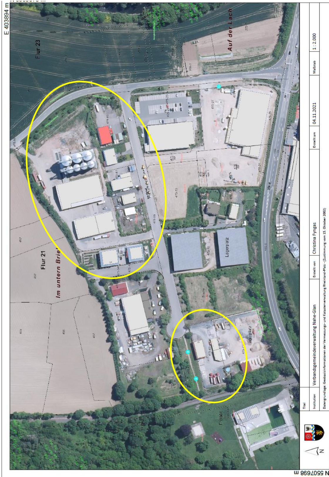
Abbildung 1: Plangebiete im Luftbild, Plangebiete gelb markiert