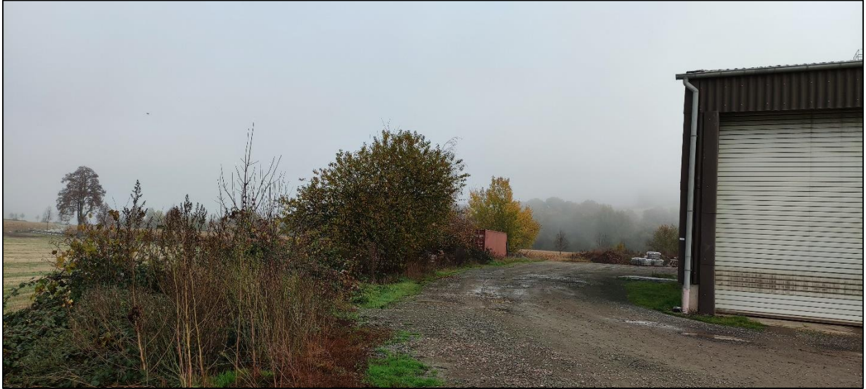
Abbildung 7: Gehölzstreifen zwischen Gewerbefläche und nördliche gelegenen Ackerflächen