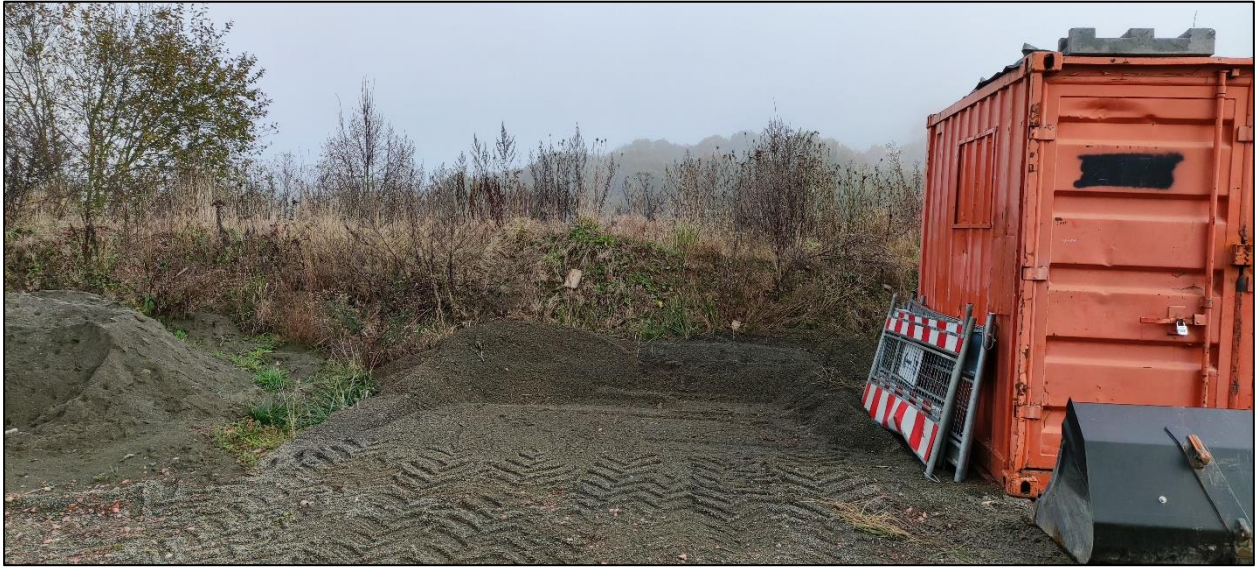
Abbildung 11: Erdwall mit vorgelagerten temporären Materiallagerungen