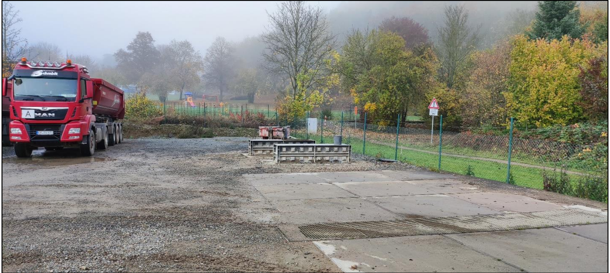
Abbildung 3: Blick auf die westliche Grundstücksgrenze und die nördlich angrenzende öffentliche Grünfläche