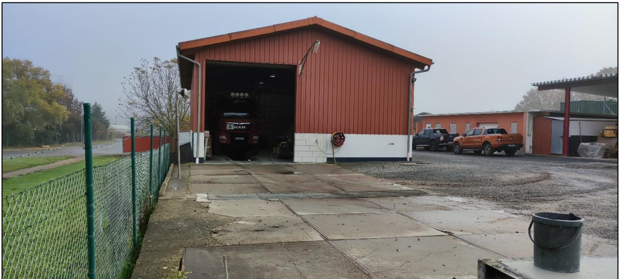
Abbildung 6: Blick von Westen auf die Gewerbefläche mit geringem Habitatpotenzial und die nördlich angrenzende öffentliche Grünfläche