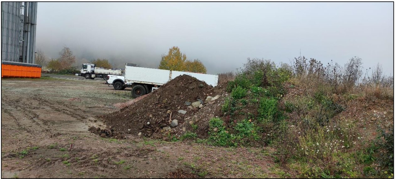
Abbildung 12: Temporäre Materiallagerungen entlang des Erdwalls