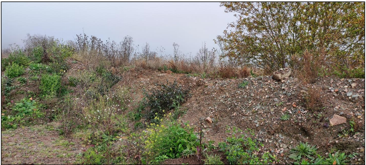
Abbildung 10: Mit einzelnen Sträuchern bewachsener Erdwall im Osten des Grundstücks