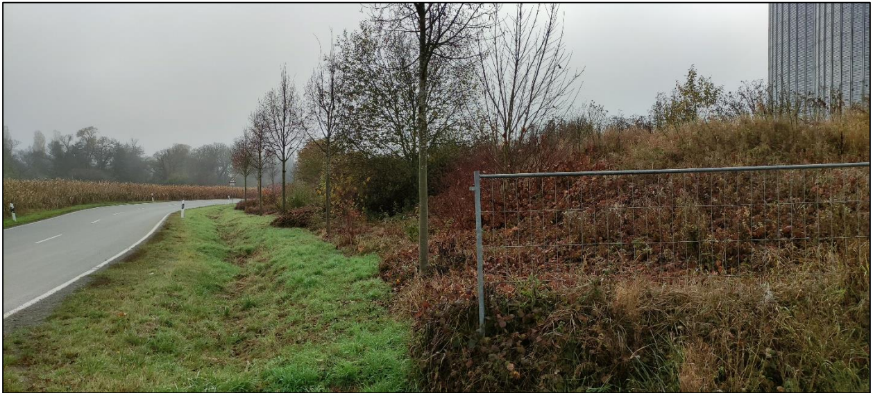
Abbildung 9: Ausgleichsfläche mit Erdwall entlang der Landesstraße im Osten