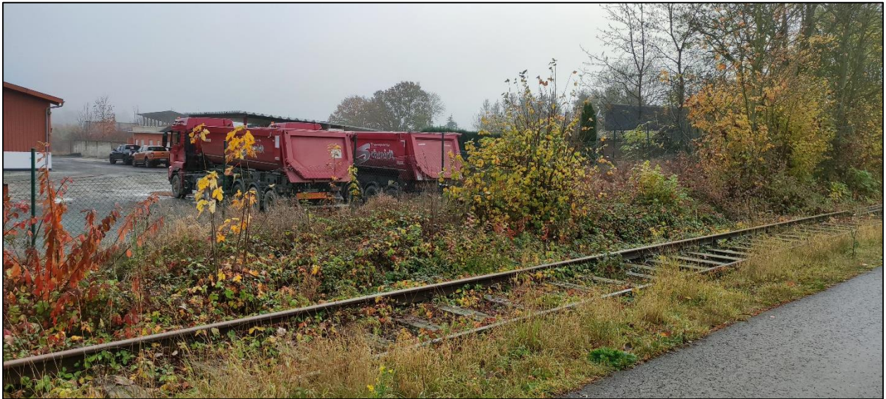
Abbildung 5: Blick von Osten auf die Böschung zwischen Gewerbefläche und Draisinenstrecke