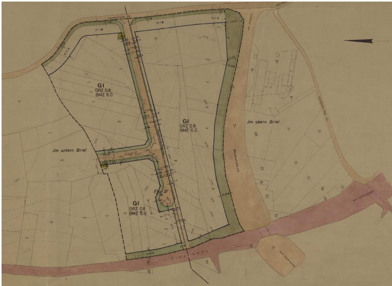
Abb. 3: Bebauungsplan „Im Briel“ vom 17.07.1970 (unmaßstäblich, nicht genordet)