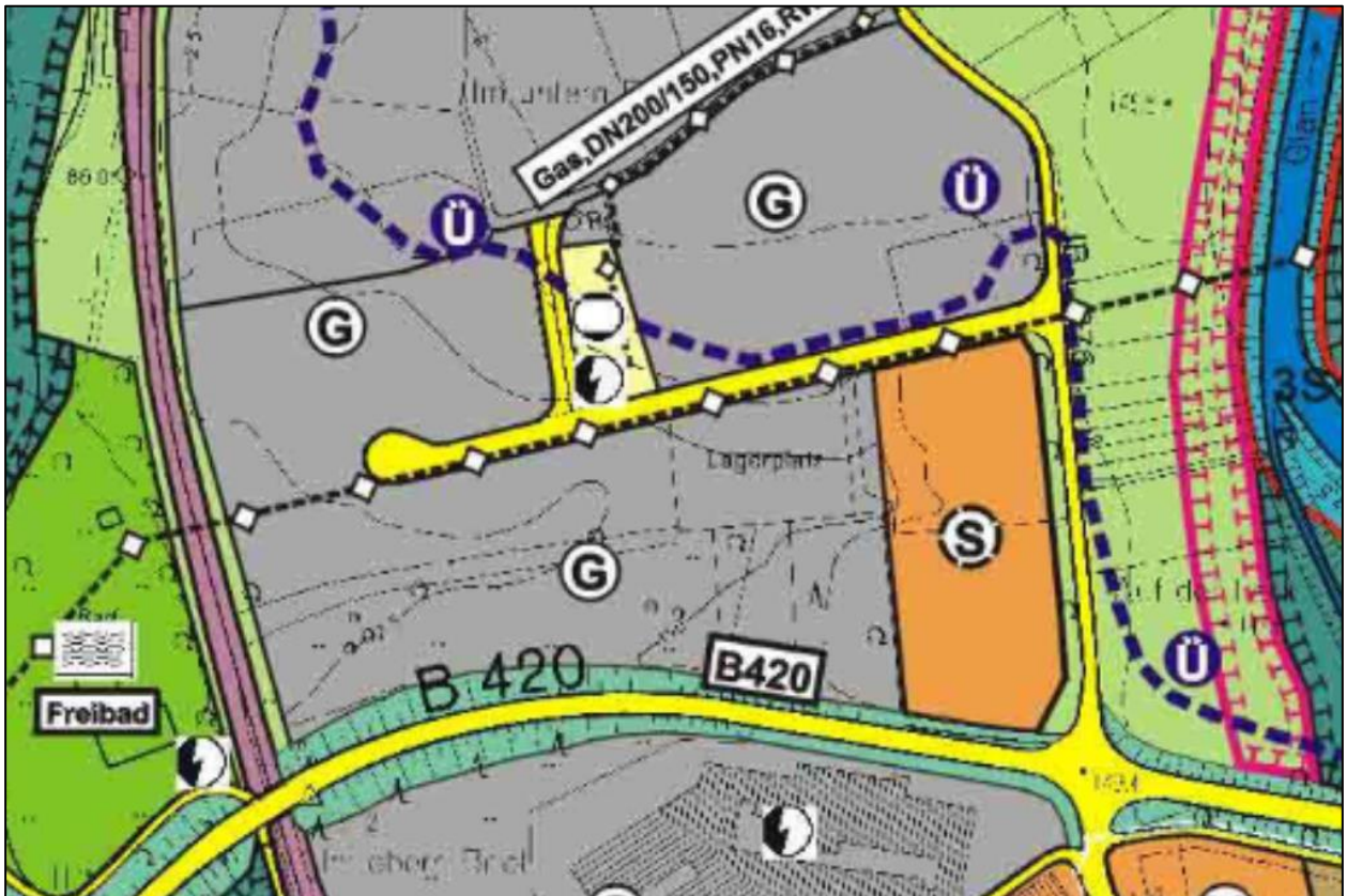
Abb. 2: Auszug aus dem rechtskräftigen FNP